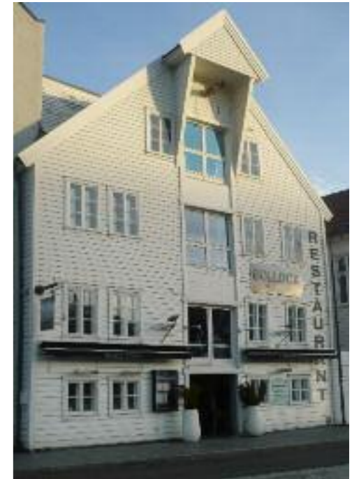
Sjøhuset på Skagenkaien, som hørte til Skagen 28.