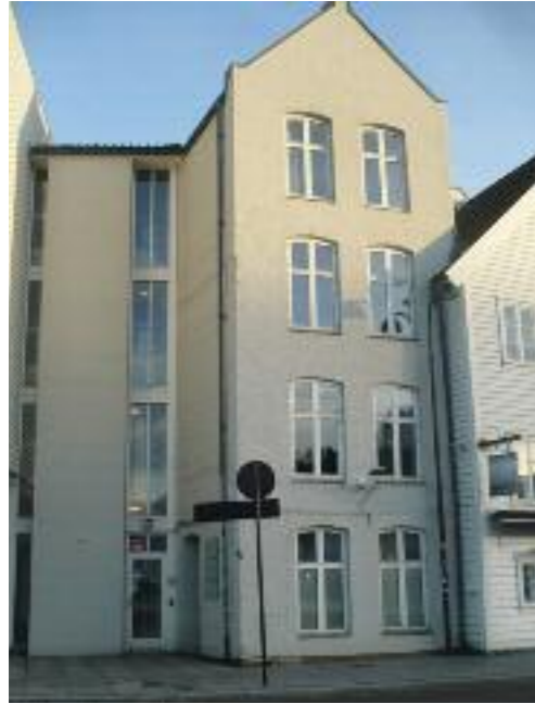
Sjøhuset på Skagenkaien, som tidligere hørte til Skagen 30. Fotograf: Arne Kvitrud i 2015.