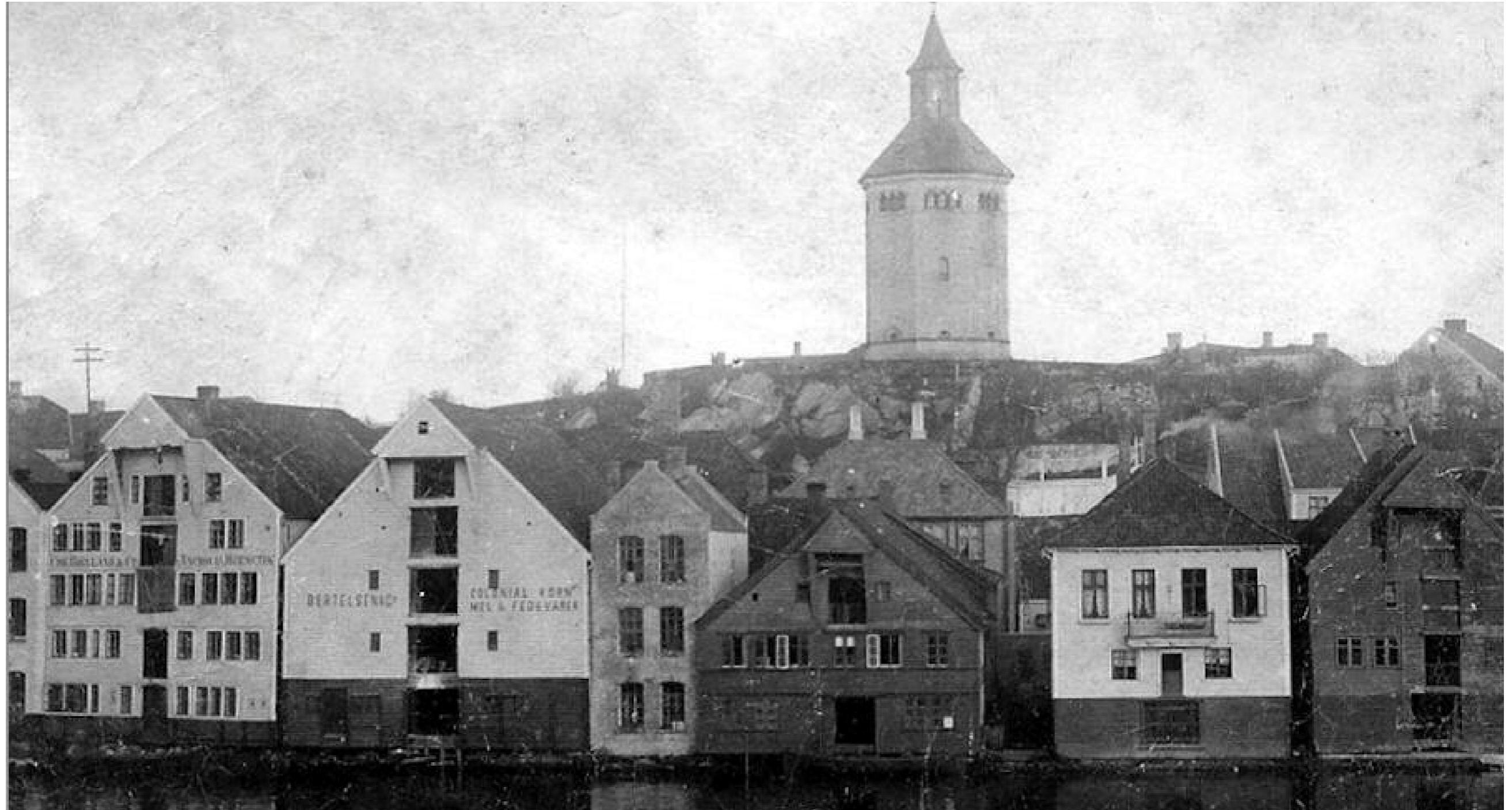
Sjøhusene på Skagen i 1898. Fra høyre Skagen 24, 26, 28, 30, 32 og 34. 19