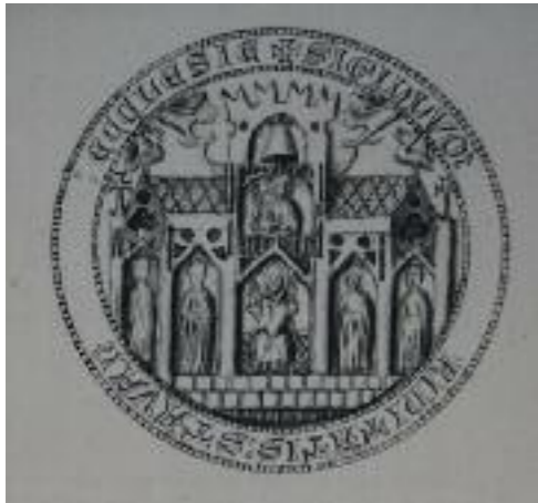
Domkapitlets segl i 1385.

Tegningen er laget av Terkel Klevenfeldt. 20