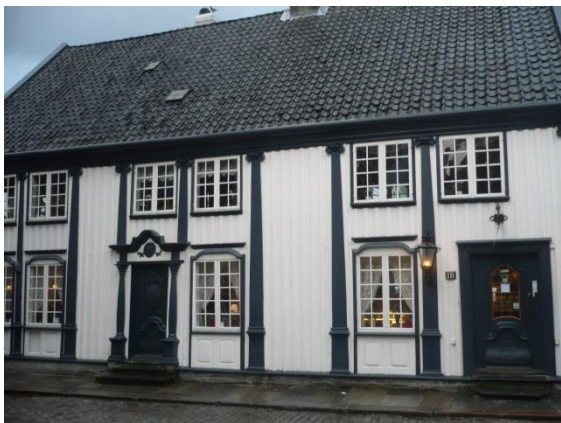
Figur 1: Under Skagen 18 har arkeologer gravd i to omganger.