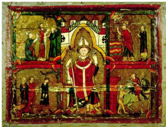
Figur 6: Alterstykke som viser sankt Martin av Tours. Det ble laget i Bergen tidlig på 1300-tallet. 38 Martinskirken var viset til Martin av Tours.

( rectori ) over Martinskirken i 1295. 34 En rektor styrte over en kirkelig institusjon. 35 Her var det nok soknepresten som var rektor for soknet og soknekirken. I 1298 var Bilev vikarprest ( vicarius ). 36 Det kan være at Aslak var sokneprest og ansatte Bilev til å stå for de daglige oppgavene. I 1330 var Sakse prest ( sira ) i Martinskirken. 37