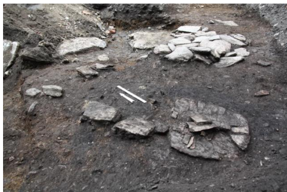
Figur 3: Resten av huset sørvest på tomta i 2014. I forgrunnen er det heller. Mellom den store hjørnehellen og det hellelagte golvet i bakgrunnen har det vært et ildsted. Pilen viser retning mot nord og tommestokken ved siden av er et metermål.

eller tidlig 1300-tall på tomta. 17 Avfallet tyder på at det var våningshus på oppsiden av smia, ikke langt unna.