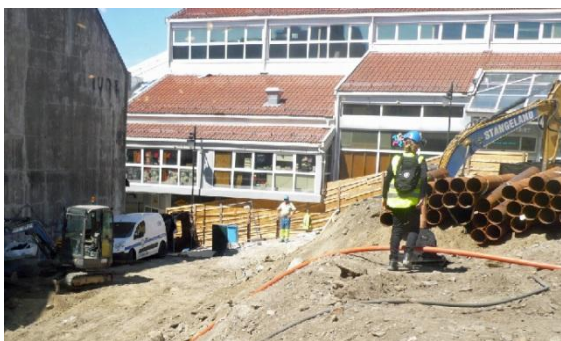
Figur 2: Tomta for Zara-huset etter rivingen av bygget til Norem Baade i 2014.